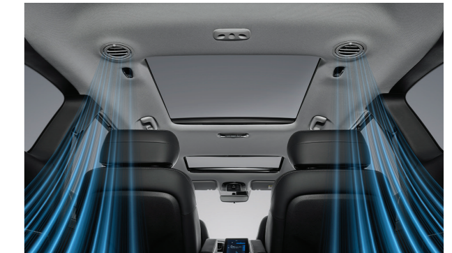
Điều hòa tự động với cửa gió cho 3 hàng ghế