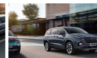
Hỗ trợ phòng tránh va chạm điểm mù