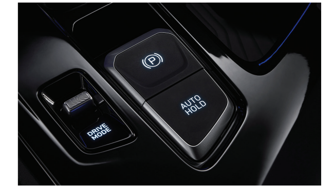
Phanh tay điện tử