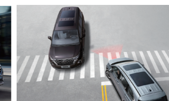
Hỗ trợ phòng tránh va chạm phía trước