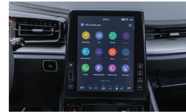
Màn hình giải trí 10.4 inch