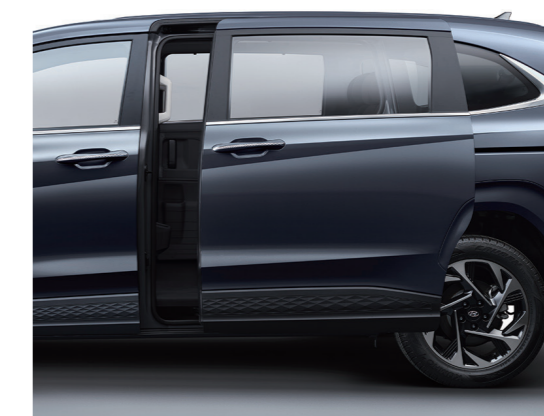
Cửa bên trượt điện