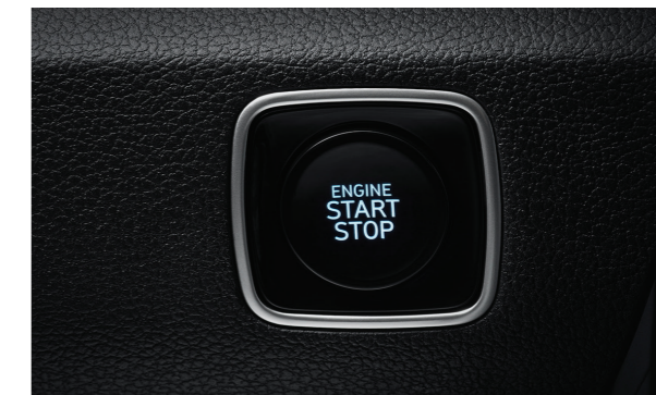
Smartkey cùng khởi động bằng nút bấm