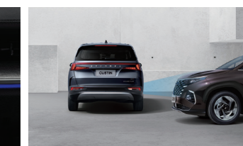
Hỗ trợ phòng tránh va chạm khi lùi xe