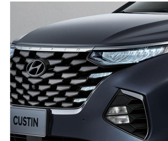
Đèn chiếu sáng LED

Cụm đèn LED thiết kế “Parametric Hidden Lights” kết hợp với các đường nét hiện đại tạo nên hình ảnh trẻ trung đẳng cấp cho Hyundai Custin.