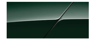
Xanh lục bảo