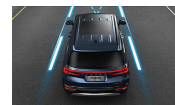
Hỗ trợ giữ làn đường