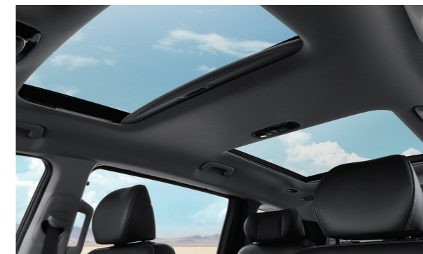
Cửa sổ trời đôi (1.5T Đặc biệt/ 2.0T Cao cấp)