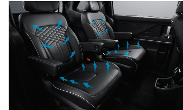
Ghế thương gia tích hợp sưởi và làm mát ghế (1.5T Đặc biệt/ 2.0T Cao cấp)