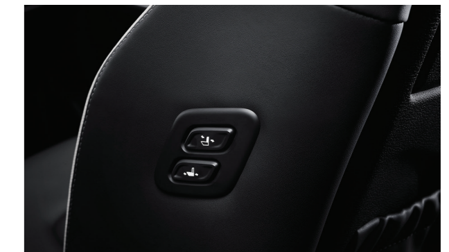
Tính năng walk-in (1.5T Đặc biệt/ 2.0T Cao cấp)