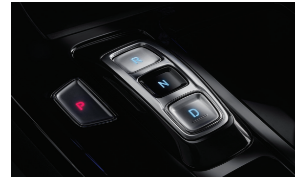
Lấy chuyển số dạng nút bấm