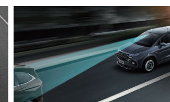
Kiểm soát hành trình thích ứng