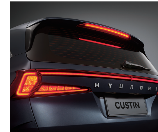
Cụm đèn hậu LED