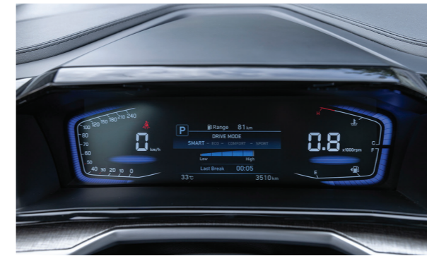
Màn hình thông tin dạng Kỹ thuật số

Thiết kế khoang nội thất lấy cảm hứng từ phi thuyền không gian, Hyundai Custin hướng đến sự thoải mái tiện nghi cho cả người lái và hành khách với phong cách sang trọng, hiện đại đi kèm một không gian rộng rãi.