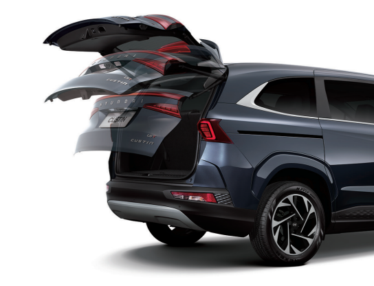
Cốp điện thông minh (1.5T Đặc biệt/ 2.0T Cao cấp)