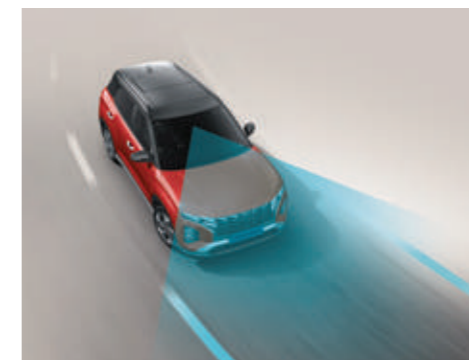
Hỗ trợ giữ làn đường LFA (Bản Cao Cấp)