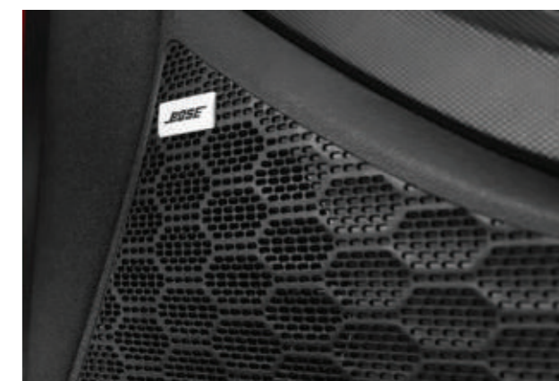
Hệ thống loa Bose cao cấp (Bản Đặc Biệt và Cao cấp)