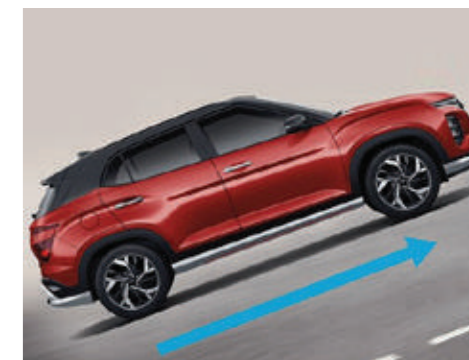
Khởi hành ngang dốc HAC (Tất cả các phiên bản)