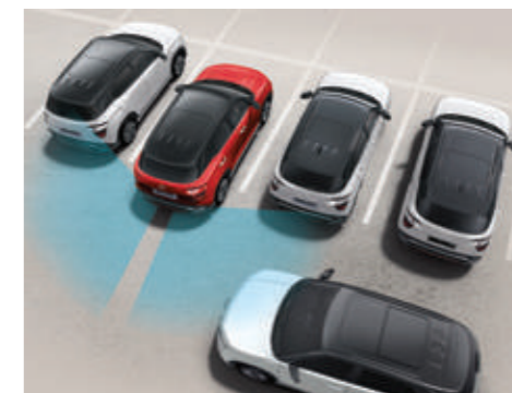
Hỗ trợ phòng tránh và chạm phía sau RCCA (Bản Cao Cấp)