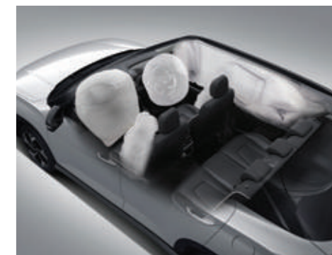
Hệ thống 6 túi khí (Bản Đặc biệt/Cao cấp)