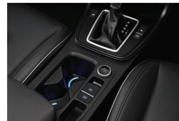
Phanh tay điện tử