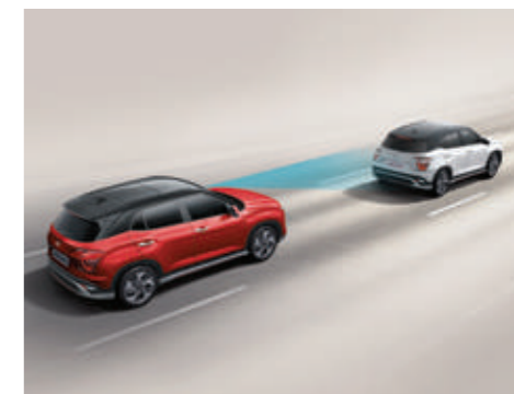
Hỗ trợ phòng tránh và chạm phía trước FCA (Bản Cao Cấp)