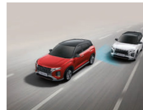
Hỗ trợ phòng tránh điểm mù BCA (Bản Cao Cấp)

Động cơ xăng SmartStream G1.5 sản sinh công suất cực đại 115 mã lực tại 6300 vòng/phút và đạt momen xoắn cực đại 144Nm tại 4500 vòng/phút