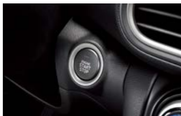
Chìa khóa thông minh kết hợp khởi động nút bấm