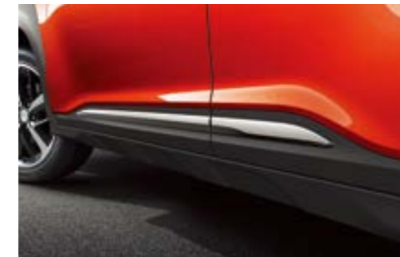
Ốp gắm thể thao