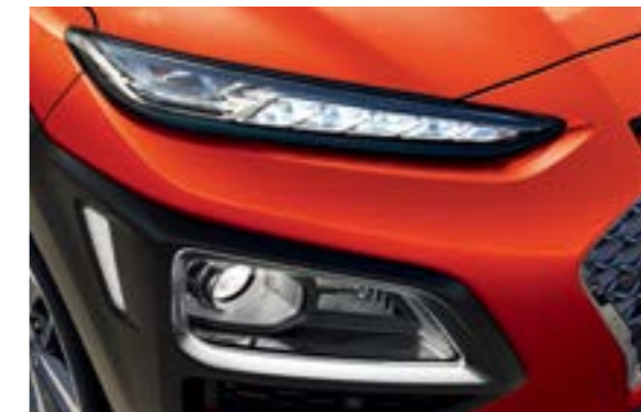
Đèn chiếu sáng Bi-LED cho 2 chế độ pha-cos