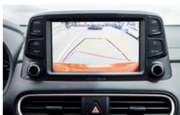
Camera lùi tích hợp