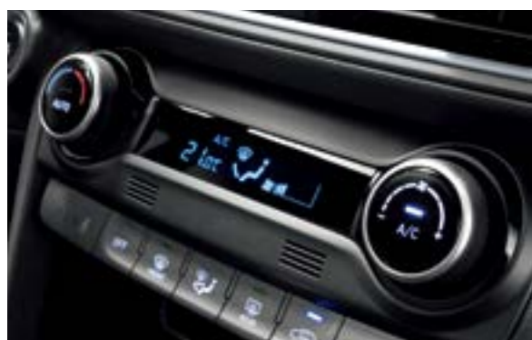
Điều hòa tự động