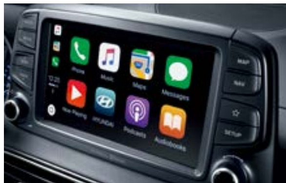
Màn hình cảm ứng 8 inch tích hợp Apple Carplay & Hệ thống định vị dẫn đường