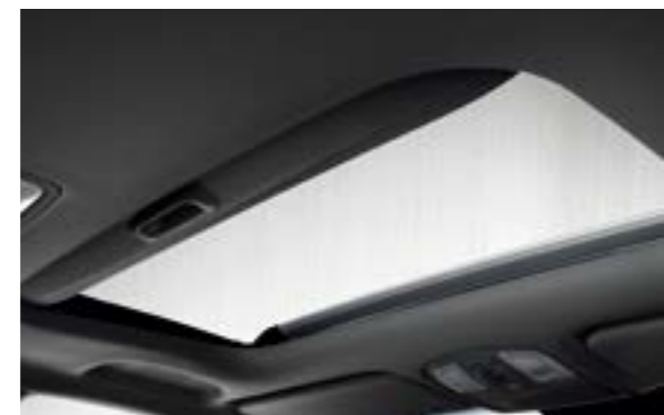
Cửa sổ trời