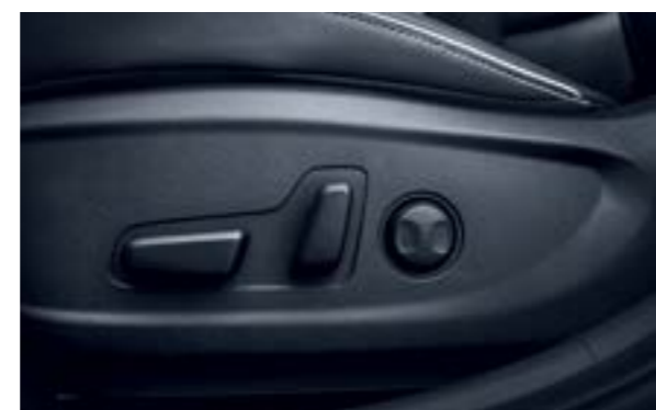
Ghế lái điều chỉnh điện 10 hướng