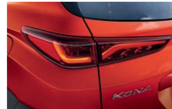
Đèn hậu dạng LED 3D