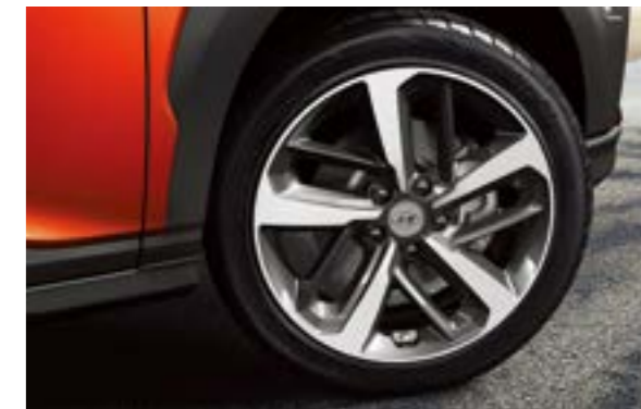
Lazang 18 inch Diamond-Cut