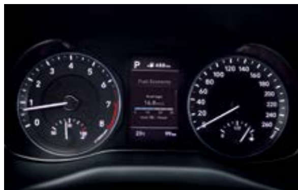
Màn hình thông tin đa chức năng 3,5 inch

Với mức độ hoàn thiện cao, chú ý đến từng chi tiết, Hyundai Kona sở hữu nội thất rộng rãi, tiện nghi và tinh tế. Những điểm nhấn về công nghệ và tính năng giúp bạn có thể cá nhân hóa không gian nội thất trở nên cá tính và độc đáo hơn.