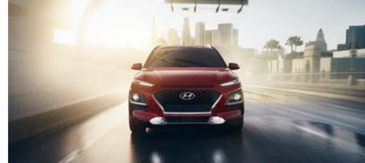
Lưới tản nhiệt thác nước Cascading Grill với các cụm đèn riêng biệt

Kết hợp các đường nét thiết kế táo bạo không kém phần tinh tế, Hyundai Kona tạo nên vẻ gợi cảm từ mọi góc nhìn. Các đường nét góc cạnh kết hợp cùng những chi tiết tạo khối ấn tượng tạo nên một thiết kế SUV mạnh mẽ. Lazang 18 inch Diamond-Cut cùng lựa chọn màu sắc cá tính nổi bật, giúp bạn khẳng định phong cách đậm khác biệt của bản thân.